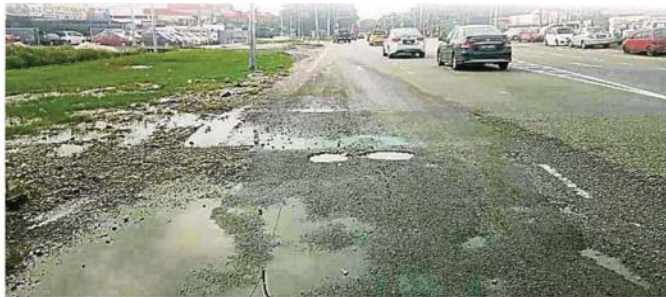
路洞成叻學叻騎士安危