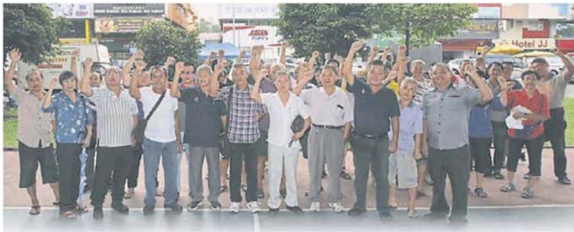
■夜市小販希望与市政厅针对垃圾清理费一事对话。