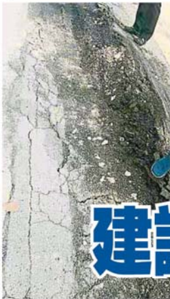
傾好的道路，因無法承受行駛車輛的壓力，再度被毀壞。