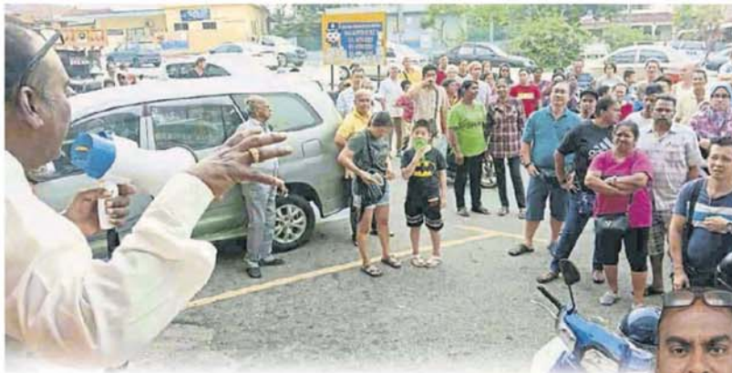
集会反对市议会徵收泊车费。 胡姬花园居民早前发动数场。

胡姬花园店寓居民是在今年9月及11月多次举办集会，反对市议会在他们的住家楼下徵收每小时50仙的泊车费，居民也曾抗议执法人员天天到场“抄三万”，并在9月提呈一份备忘录给市议会。