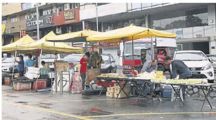
■灵市政厅向夜市小贩征收垃圾清理费措施,怨声四起。