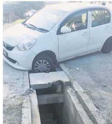
沟渠盖不见后，轿车撞落洞。