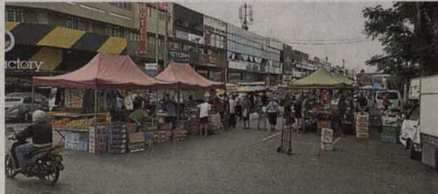
八打靈再也市政廳6月突然決定向流動夜市小販征收攤格費，让小販措手不及。

（八打靈再也17日訊）八打靈再也流動夜市小販指八打靈再也市政廳在今年6月，突然發函要求小販從7月開始必須繳付攤格費，靈市政廳這項措施並未給予緩衝期，致小販們求助無門而心生不滿。