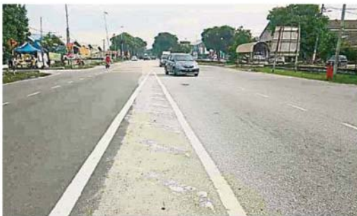
巴生港口道路街燈失靈，所以入夜時分道路一片昏暗。