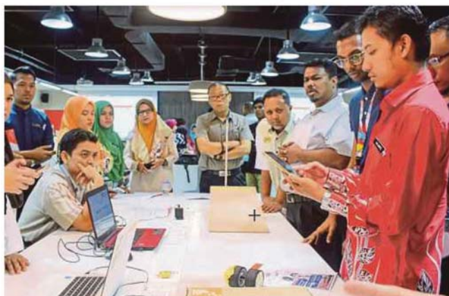
Telekom Malaysia Bhd and Creative Mind's TM Nano Maker Kit programme exposes school teachers and students to data logging.