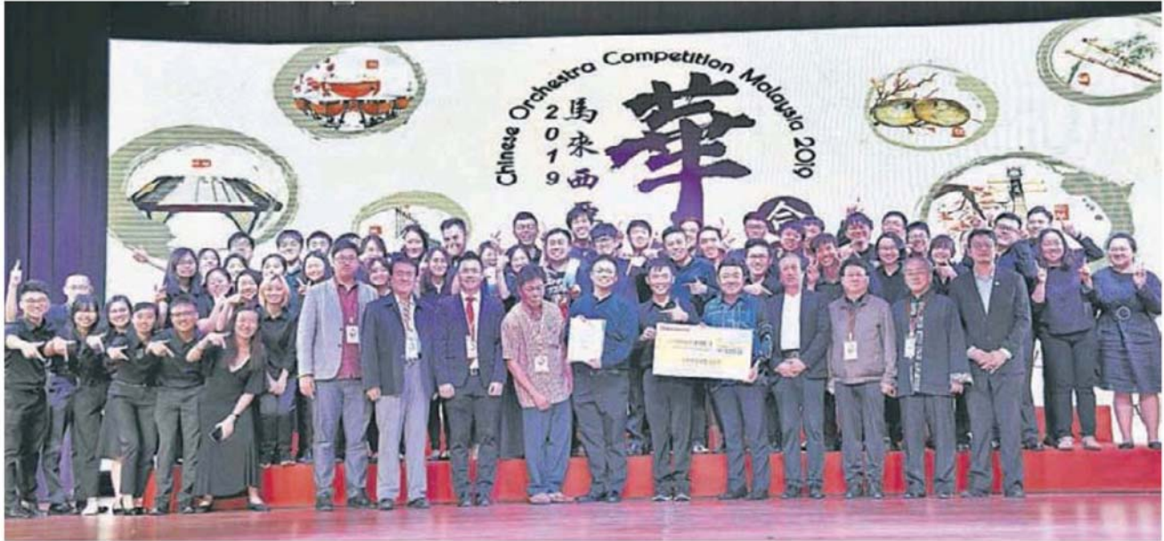
■天地人和民族乐团凭藉高超的演奏水平，摘下第一奖宝座。

(吉隆坡17日讯)由雪隆海南会馆主办，执行单位为雪隆海南会馆青年团的“2019马来西亚华乐合奏大赛”，日前在天后宫礼堂圆满落幕，经过一番高超竞技较量，最终由来自吉隆坡的天地人和民族华乐团技高一筹，从8支竞逐队伍中脱颖而出，摘下第一奖殊荣。