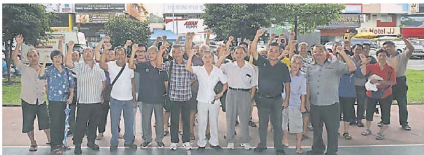
夜市小贩希望和市政厅对话，商议垃圾清理费的事。