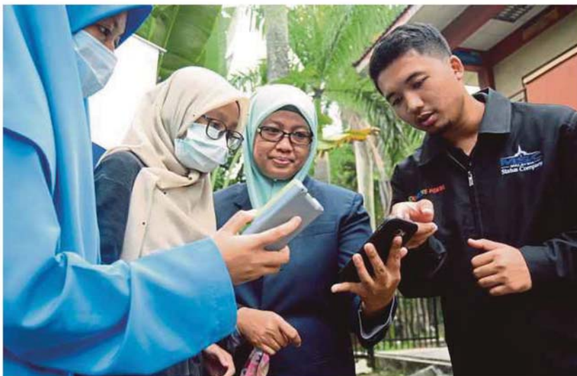
A Creative Minds representative (right) showing a SMK Bandar Baru Sungai Buloh's teacher and her students how to use the data logger to obtain an air pollutant index reading.

"There are a lot of limitations in the classroom to study natural phenomena. This is due to technological barriers, which inhibit scientific investigations.