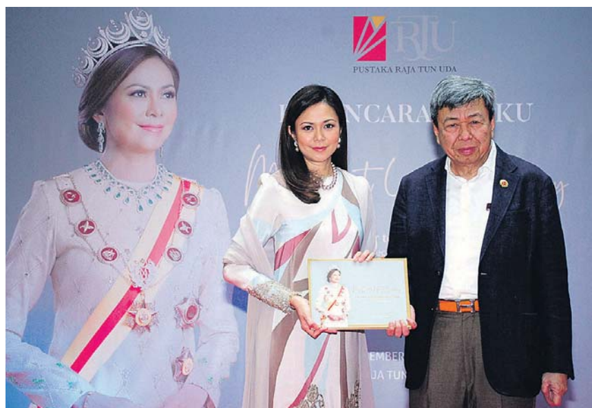
Sultan Sharafuddin dan Tengku Permaisuri Norashikin berkenan bergambar bersama buku My First Year Journey From TV News Anchor to Tengku Permaisuri Selangor yang dirasmikan oleh Sultan Selangor di Pustaka Raja Tun Uda, Shah Alam kelmarin.

Tengku Permaisuri Norashikin ialah Penaung Diraja bagi kempen tersebut yang dianjurkan Persatuan Pencegahan