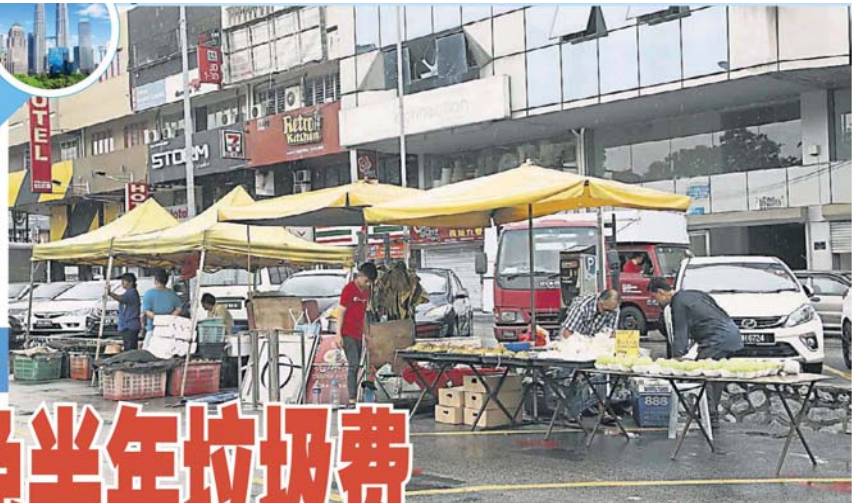
灵市政厅向夜市小贩征收垃圾清理费。

八打灵再也 3 个夜市公会，包括 SS2 八打灵再也夜市公会、梳邦八打灵再也流动夜市小贩公会和 SS3 夜市公会，昨日联合召开记者会，希望市政厅听从小贩心声，尽快与公会对话，商讨双赢方案。