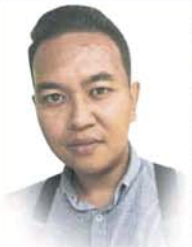
艾德里:市议会已 减低泊车月票。