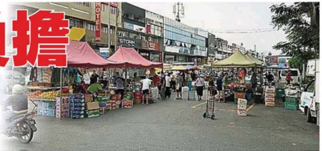
八打灵再也市政厅今年6月突然向流动夜市小販征收摊格费, 并从7月开始征收, 让小販措手不及。